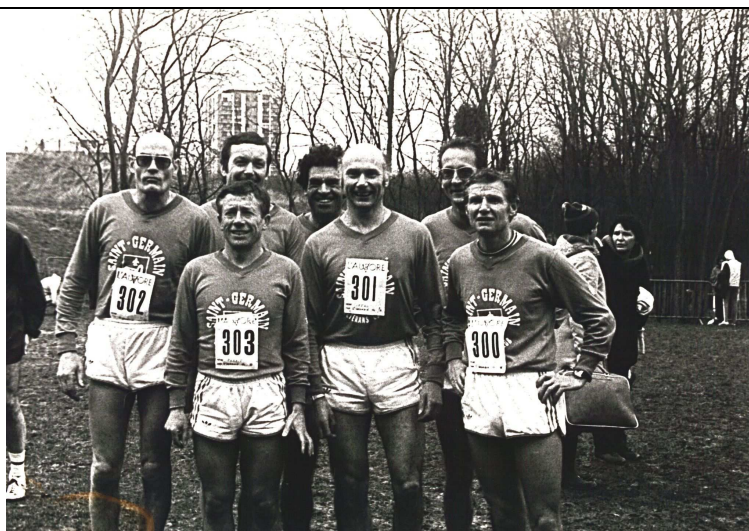
Equipe de cross du SGV C

Il a représenté également le club et la région en équipe LIFA lors d'un match France -Belgique.